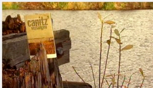
Die Flüsse von Demmin bergen ein schreckliches Geheimnis